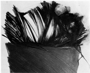
"Le condizioni del volo" cm. 70x100 (particolare) "Le condizioni del volo" cm. 70x100 (particolare)